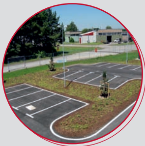
• Straßen & Wege