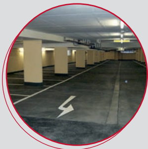
• Parkplätze & Parkhäuser